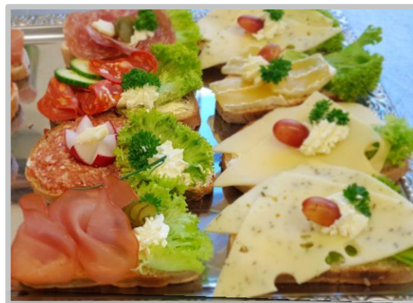
Canapé 4, 9, 12

4 Geschmacksverstärker 9 Konservierungsmittel 12 Gluten