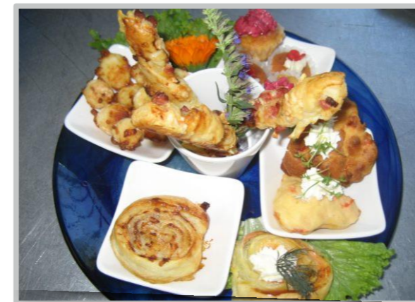
Snack-Teller 4, 12